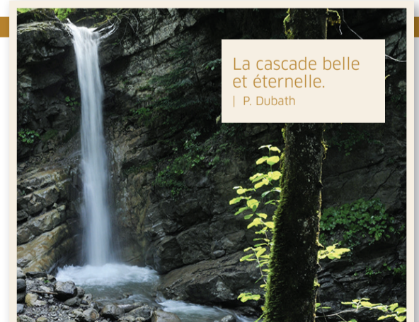
La cascade belle et éternelle. | P. Dubath

par cœur, s'arrête toujours au même endroit – le large méandre bien profond – car il sait que la grosse truite ou le bel ombre (plus tard dans la saison) se tient par ici et qu'un jour, le poisson recherché finira dans le sac en bandoulière. Celui qui va toujours seul, ou cet autre qui préfère accompagner l'ami ou le frère, et boire un café en fin de matinée pour évoquer, déjà, les premières émotions, la couleur des eaux, l'accrochage dans les branches immergées, le cingle plongeur sorti comme un avion du courant dans lequel il quêtait en marchant sa nourriture pour ses petits. Car le cingle est un des premiers oiseaux à construire son nid, qu'il bâtit vaillamment dans des endroits discrets, mais souvent submergés. Je suis fait d'un peu de tout cela. Je suis un pêcheur multifacettes que les années forcent à ralentir. J'aime savoir que dans ce grand courant, il peut y avoir un joli poisson et que si je m'y prends bien, je tromperai sa méfiance. Je le ramènerai sur la rive, je le décrocherai et je le relâcherai délicatement dans le courant (mais chut, c'est interdit par la loi!). Je le regarderai partir, les points rouges sur ses flancs, sa façon de glisser lentement jusqu'à une grosse pierre contre laquelle il ira se blottir. Mais il n'y a pas que la pêche. Il y a dans le creux des rivières encore préservées une attention au monde